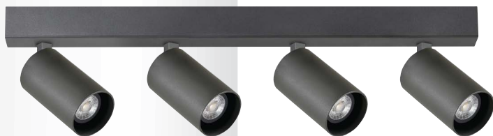
LED COIN 50 COB B

svítidlo pro stropní i nástěnnou montáž • LED zdroj COIN 50 COB • otočné o 355° a výklopné do 90° • těleso z hliníkového profilu • volitelné barevné provedení • volitelná barva kroužku COIN 50 COB černá nebo bílá • zdroje jsou součástí svítidla • střední dimenzovaná životnost svítidla 50 000h L70/B50 při Ta = 25°C • barevná odchylka MacAdam 2 SDCM • kombinace chromatičnosti, úhlů, příkonu a CRI možná