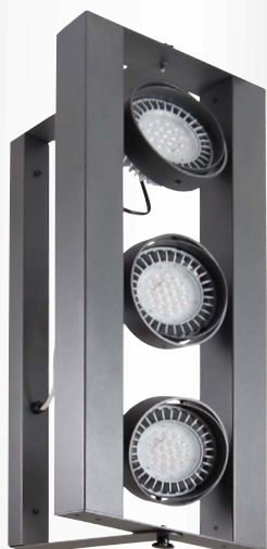
LED COIN 111 AC

nástěnné svítidlo • LED zdroj COIN111 AC nebo elektronický předřadník a zdroj COIN111 • možnost natočení celého svítidla o 180° • kardanový systém s možností natočení zdrojů o cca 2 x 30° • konstrukce z ocelového plechu a hliníkového profilu • střední dimenzovaná životnost svítidla 50 000h L70/B50 při Ta = 25°C • barevná odchylka MacAdam 3 SDCM • volitelné barevné provedení