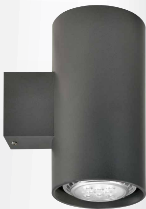
2x LED PAR30