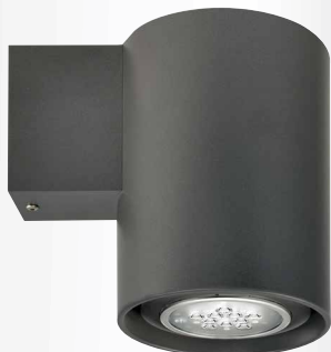
1x LED PAR30

nástěnné svítidlo pro LED zdroje s jednostranným nebo oboustranným vyzářováním • těleso z lakovaného hliníkového profilu • vertikální poloha zdrojů